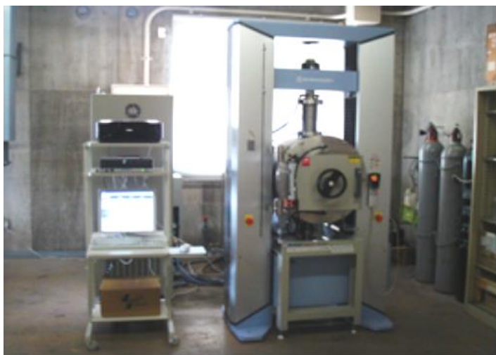
試験装置外観写真