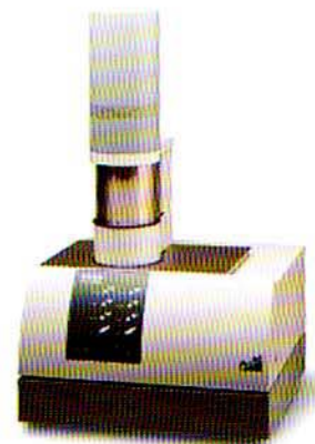
図3 熱定数測定装置概観写真

岡山セラミックスセンターでは当機器を使用して、依頼測定を実施しておりますので、お気軽にお問い合わせ下さい。